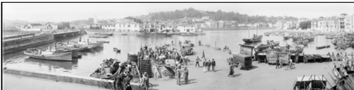
② Saint-Jean-de-Luz, panoramique

Des maquettes de navires de pêche et des demi-coques de chantiers, des cartes et des plans d'archives compléteront l'exposition.