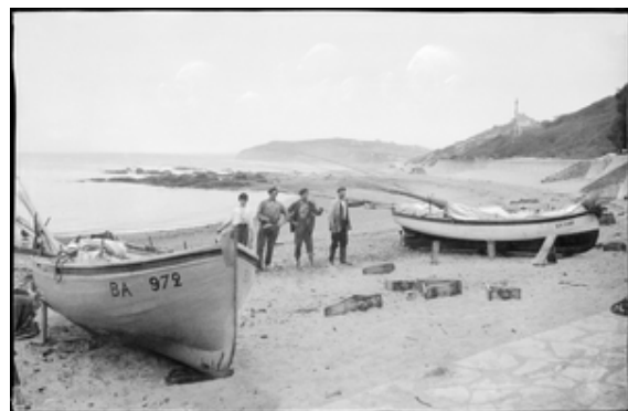
⑤ Guethary

L'association possède une collection d'objets et de documents originaux. Elle réalise aussi des maquettes d'authentiques navires basques. Elle est connue dans ce domaine par les bateaux qu'elle a reconstitués (le battel « Itsas begia » et la grande chaloupe « Brokoa », réplique d'une chaloupe biscayenne de la fin du XIX e siècle).