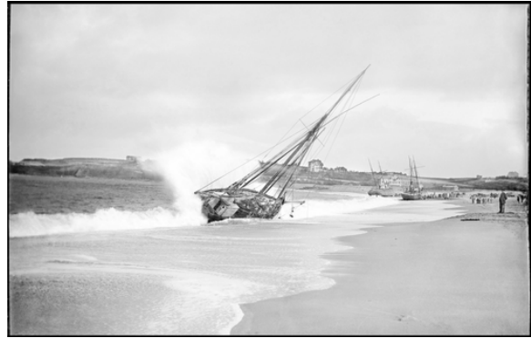
③ Saint-Jean-de-Luz, 5 nov 1890