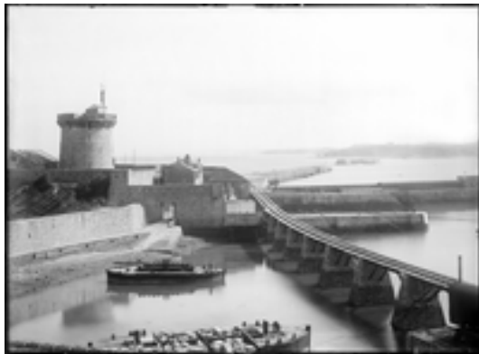
④ Fort de Socoa