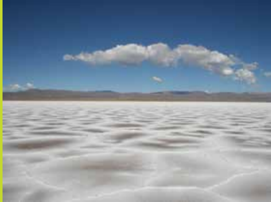
→ © Benjamin Anslado Villaseca