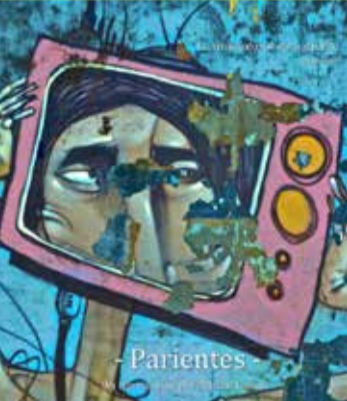
→ Affiche du film Parientes