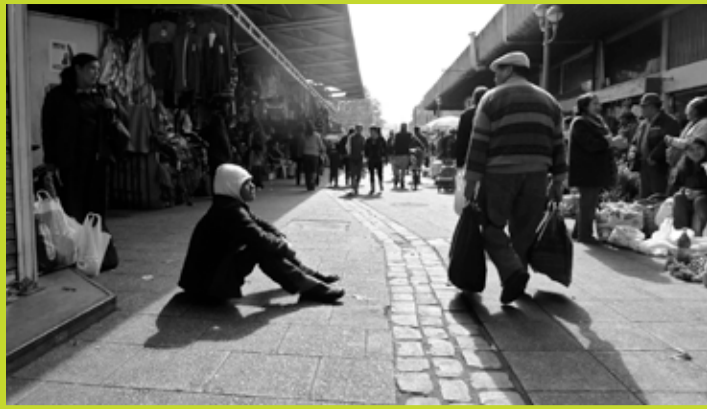
→ Exposition Warriaches