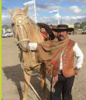
→ El Gaucho