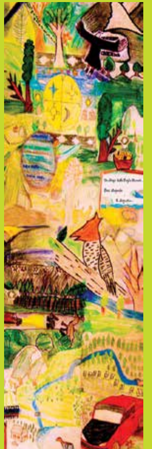
→ École 161 : travaux d'élèves