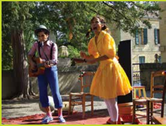
→ Théâtre au Vent